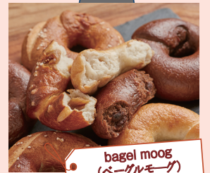
bagel moog (ペーグルモーグ)