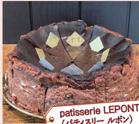
patisserie LEPONT (パティスリー ルボン)