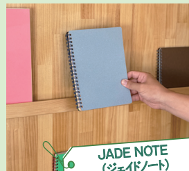
JADE NOTE (ジェイドノート)