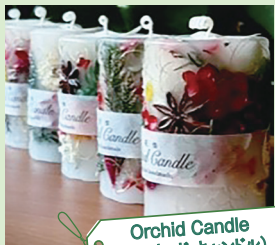
Orchid Candle (オーキッド キャンドル)