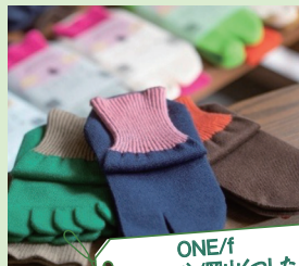
ONE/f (ワンエフ)/岡山くつした