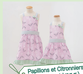
Papillons et Citronniers (パピオン エシトロニエ)