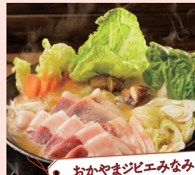
おかやまジビエのみみ