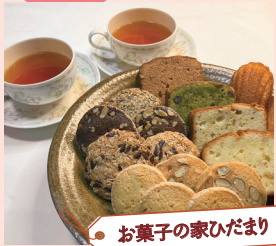
お菓子の家ひだまり